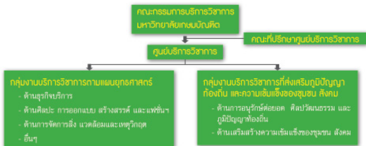
โครงสร้างการบริหารการบริการวิชาการ มหาวิทยาลัยเกษตรศาสตร์

องค์การอิสระ การบริการวิชาการนอกจากเป็นประโยชน์ให้แก่สังคมแล้ว มหาวิทยาลัยยังได้รับการยอมรับจากสังคมภายนอก คือ เพิ่มพูนความรู้และประสบการณ์อันจะนำไปสู่การพัฒนาหลักสูตร มีการเชื่อมโยงประสบการณ์ที่ได้เพื่อไปใช้ประโยชน์ในด้านการเรียนการสอนและการวิจัย พัฒนาตำแหน่งทางวิชาการของอาจารย์ และการสร้างเครือข่ายกับภาคส่วนและองค์การต่างๆ